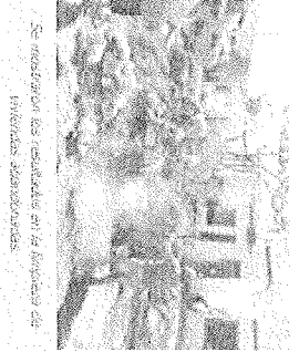
Se muestran los resultados en la ejecución de las obras de infraestructura pública.

En virtud de ser el municipio el responsable de la ejecución de las obras de infraestructura pública en la zona de la Unidad Habitacional 1000, y de ser el Infonavit el responsable de la ejecución de las obras de infraestructura pública en la zona de la Unidad Habitacional 1000, se ha suscrito un convenio de colaboración entre el Gobierno Municipal de Juárez y el Infonavit, para la ejecución de obras de infraestructura pública en la zona de la Unidad Habitacional 1000.